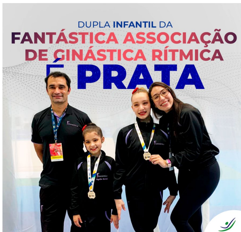
CAMPEONATO BRASILEIRO DE GINÁSTICA RÍTMICA “ILONA PEUKER”